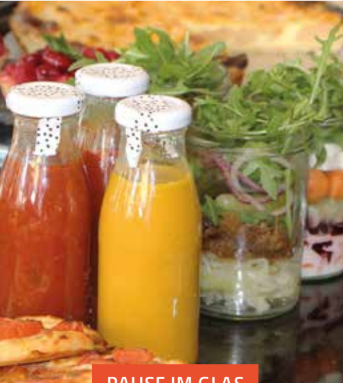
PAUSE IM GLAS